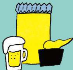
THE GOLDEN FLAME